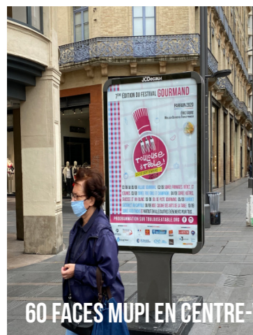
60 FACES MUPI EN CENTRE-