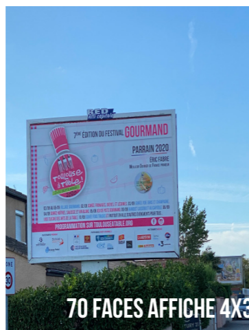
70 FACES AFFICHE 4X3