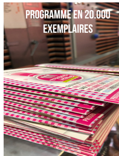
PROGRAMME EN 20.000 EXEMPLAIRES