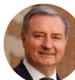
Jean-Luc Moudenc Maire de Toulouse Président de Toulouse Métropole

«La Région Occitanie soutient TàT car notre région a une formidable particularité : c'est que l'agriculture et l'agroalimentaire représentent 165.000 emplois. Nous avons la chance d'avoir de fabuleux produits, souvent sous labels de qualité, qui sont magnifiés par les métiers de bouche. Nous avons une vraie authenticité que nous partageons au travers de festival toulouse à Table ! »