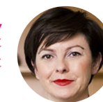
Carole Delga Présidente de la Région Occitanie Pyrénées Méditerranée

«Le MIN Toulouse Occitanie vient d'être créé, nous allons l'exploiter et essayer de le développer. Dans cette recherche de rayonnement, Toulouse à Table ! est le premier événement dans lequel le MIN pouvait s'investir pour s'affirmer comme étant un pôle agroalimentaire important dans la région. Quand je vois l'assemblée présente, je me dis que c'est pari gagné!»