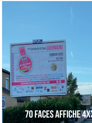
70 FACES AFFICHE 4X3