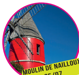
MOULIN DE NAILLOUX 05/07