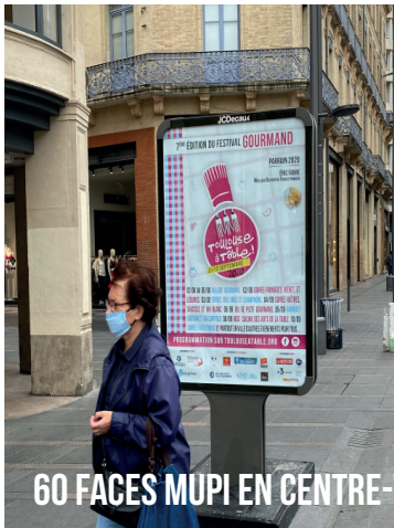
60 FACES MUPI EN CENTRE-