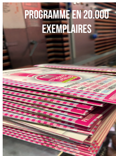
PROGRAMME EN 20.000 EXEMPLAIRES