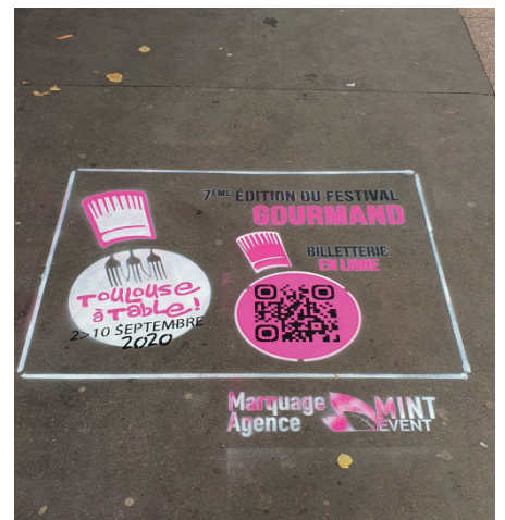
Marquage Agence MINT EVENT