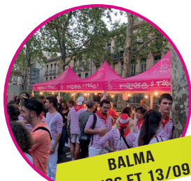
BALMA 13/06 ET 13/09