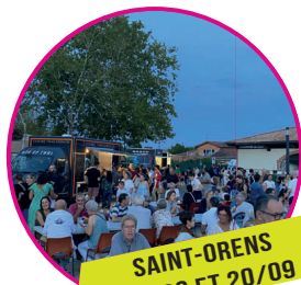
SAINT-ORENS 27/06 ET 20/09