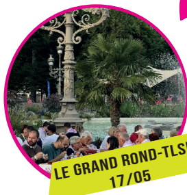
LE GRAND ROND-TLSE 17/05