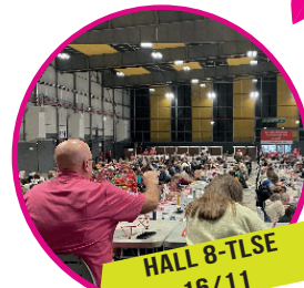
HALL 8-TLSE 16/11